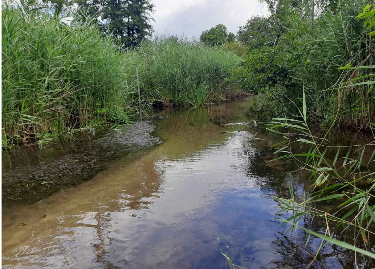
Abb. 3: Der Gundbach am NSG Mönchbruch ist ein seit langem besiedeltes Gewässer (A. Malingner).

Die Weibchen zeigen am Eiablagehabitat ein heimliches Verhalten. Die Eiballen werden meist im offenen Wasser oder in der Deckung dichter Vegetation in kurzer Zeit durch mehrmaliges Eintauchen des Hinterleibes abgesetzt.