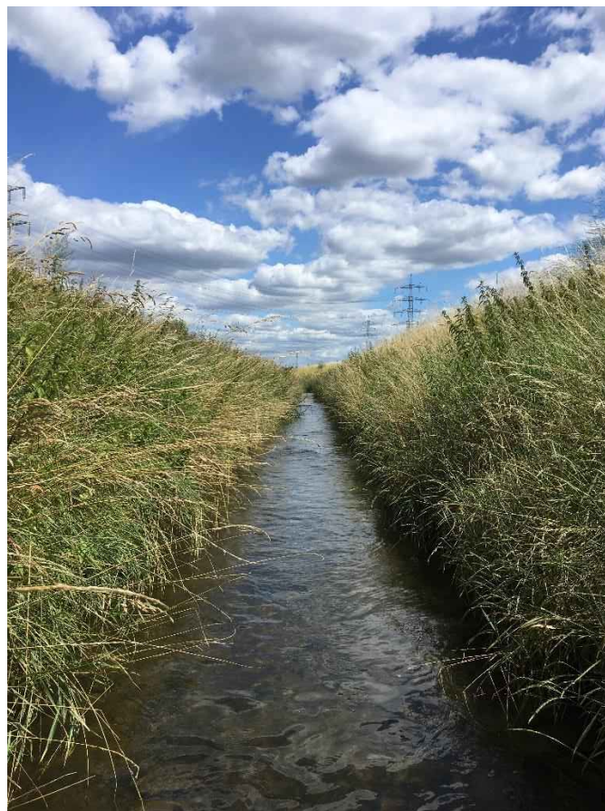
Abb. 2: Typischer Lebensraum der Grünen Flussjungfer in Südhessen.

Die Larven zeigen nur eine geringe Bindung an bestimmte Substrateigenschaften und leben an vegetationsarmen Stellen von Sandbänken oder Grob- und Mittelkiesablagerungen. Sie können auch stärkere Strömungen tolerieren. Hierbei lauern sie entweder oberflächlich vergraben im Substrat auf Beute, oder jagen auch aktiv auf dessen Oberfläche (MÜLLER et al. 2015). Anders als Gomphus vulgatissimus und G. flavipes meiden die Larven stärkere Schlammablagerungen. In geeigneten Gewässern leben bis zu zehn Larven pro Quadratmeter. Die Larvalentwicklung dauert normalerweise drei bis vier Jahre.