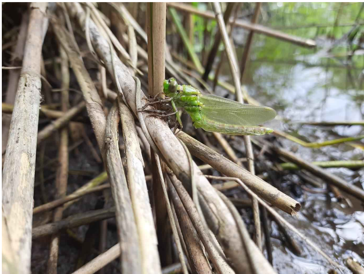
Abb. 1: Emergenz der Grünen Flussjungfer – Ophiogomphus cecilia (C. Morbitzer).

Die Grüne Flussjungfer ( Ophiogomphus cecilia , Fourcroy 1785) ist eine Großlibelle (Anisoptera) aus der Familie der Flussjungfern (Gomphidae). Sie wird im Anhang II und IV der FFH-Richtlinie (92/43/EWG) geführt. Charakteristisch sind der leuchtend grüne Kopf, Augen und Thorax (DIJKSTRA & LEWINGTON 2006).